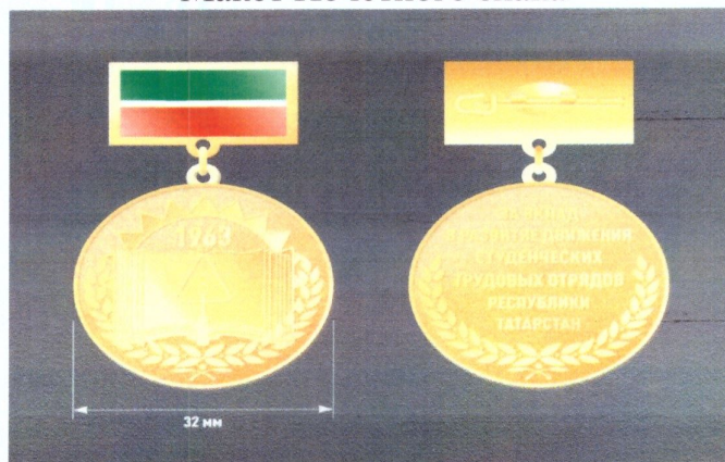
Макет Почетного знака

Медаль при помощи ушка и кольца соединяется с прямоугольной колодкой размером 26x16 мм, залитой эмалью в виде ленты с горизонтальными полосами зеленого, белого, красного цветов; белая полоса составляет 1/15 ширины ленты и расположена между равными по ширине полосами зеленого и красного цветов. На оборотной стороне колодки имеется булавка для крепления к одежде.