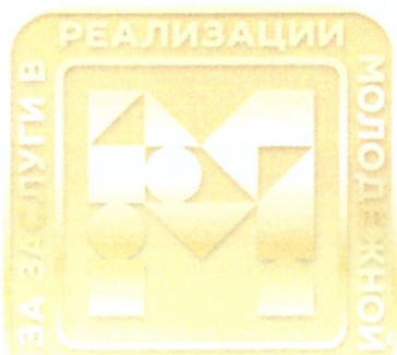
Макет Золотого знака